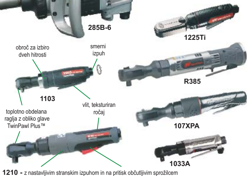
obroč za izbiro dveh hitrosti

2) - Za naročilo kompleta z inteligentnim polnilcem in dvema NiCd ali Lilon akumulatorjema dodajte -2N, -2L. Teža z Lilon akumulatorjem.