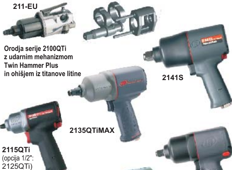
2115QTi (opcija 1/2": 2125QTi)

2) - Za naročilo kompleta z inteligentnim polnilcem in dvema NiCd ali Lilon akumulatorjema dodajte -2N oz. -2L. Teža z Lilon akumulatorjem. Prav tako na voljo: W040SQ - s štiriobim nastavkom 1/4", W150QC - z glavo za hitro menjavo 1/4", W360P - z zunanjim štiriobim nastavkom