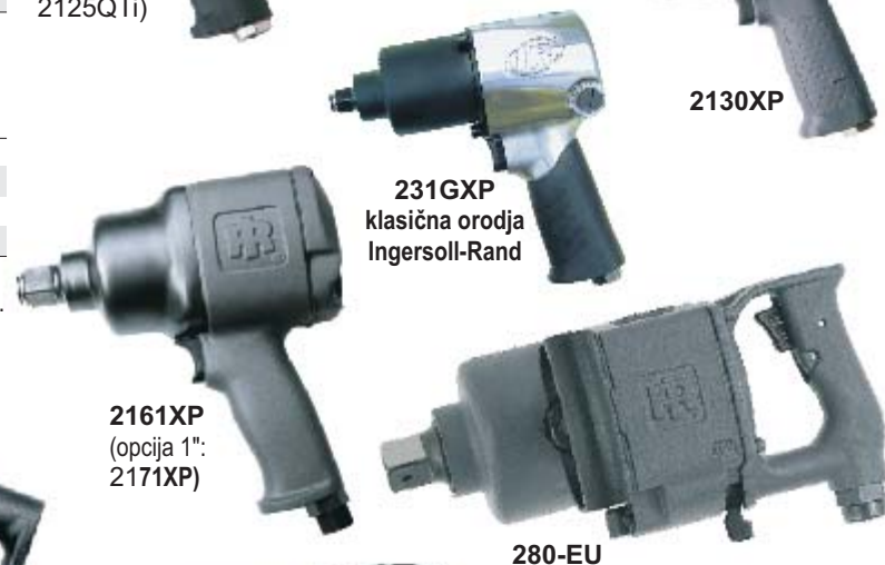
231GXP klasična orodja Ingersoll-Rand